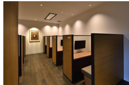
イベント中もお仕事という方には、いくつものブースも完備。