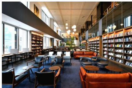
広いスペースでゆったりと懇談を。

SHARE LAUNGEについて、詳しくはこちらから。満席の場合はご利用をお待ちいただきます。