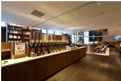
ソフトドリンクやスナックも自由にご自由どうぞ。